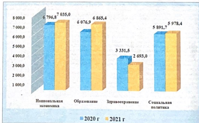
Диаграмма 2. Структура расходов республиканского бюджета Республики Алтай, млн. рублей

По заказу Министерства финансов Республики Алтай